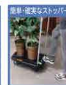
庫車・確実なストッパー